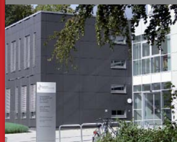
Bildungszentrum des Städtischen Krankenhauses Kiel