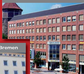
ecos office center, Hannover