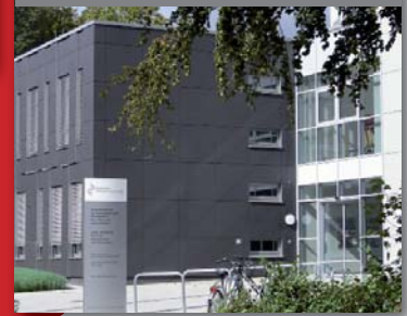
Bildungszentrum des Städtischen Krankenhauses Kiel