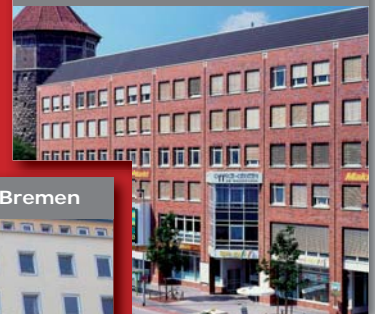
ecos office center, Hannover