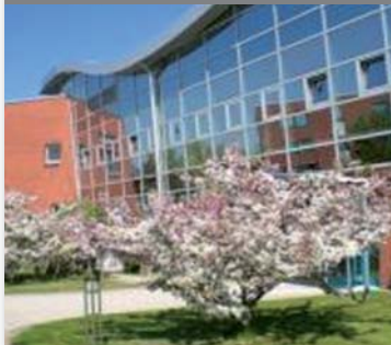
Wirtschafts- und Technik- akademie oder Technologie- zentrum Warnemünde e.V.