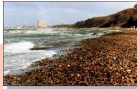
Ganz in der Nähe: die Ostsee