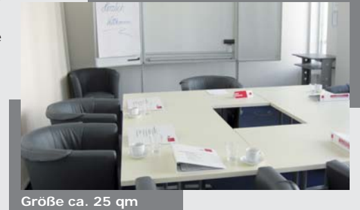
Größe ca. 25 qm